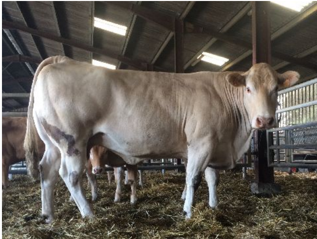
Naisseur: GAEC L'HOPITAL DE Propriétaire: GAEC L'HOPITAL DE 14410 VALDALLIERE