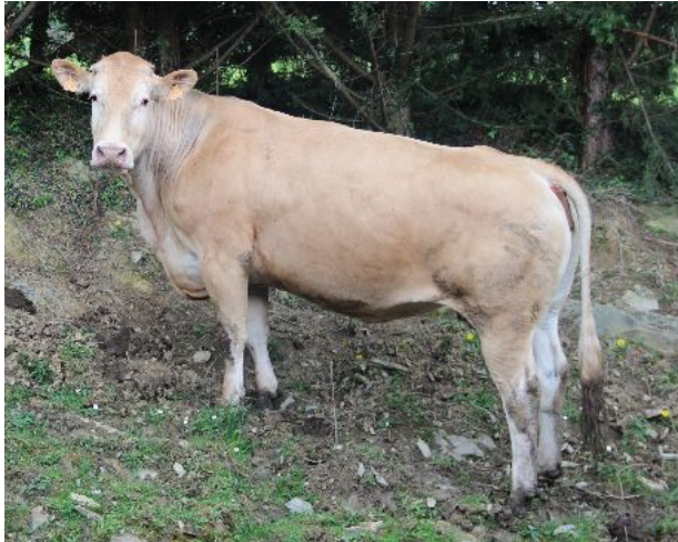
Naisseur: ARBELBIDE LOUIS Propriétaire: ARBELBIDE LOUIS 64640 HELETTE